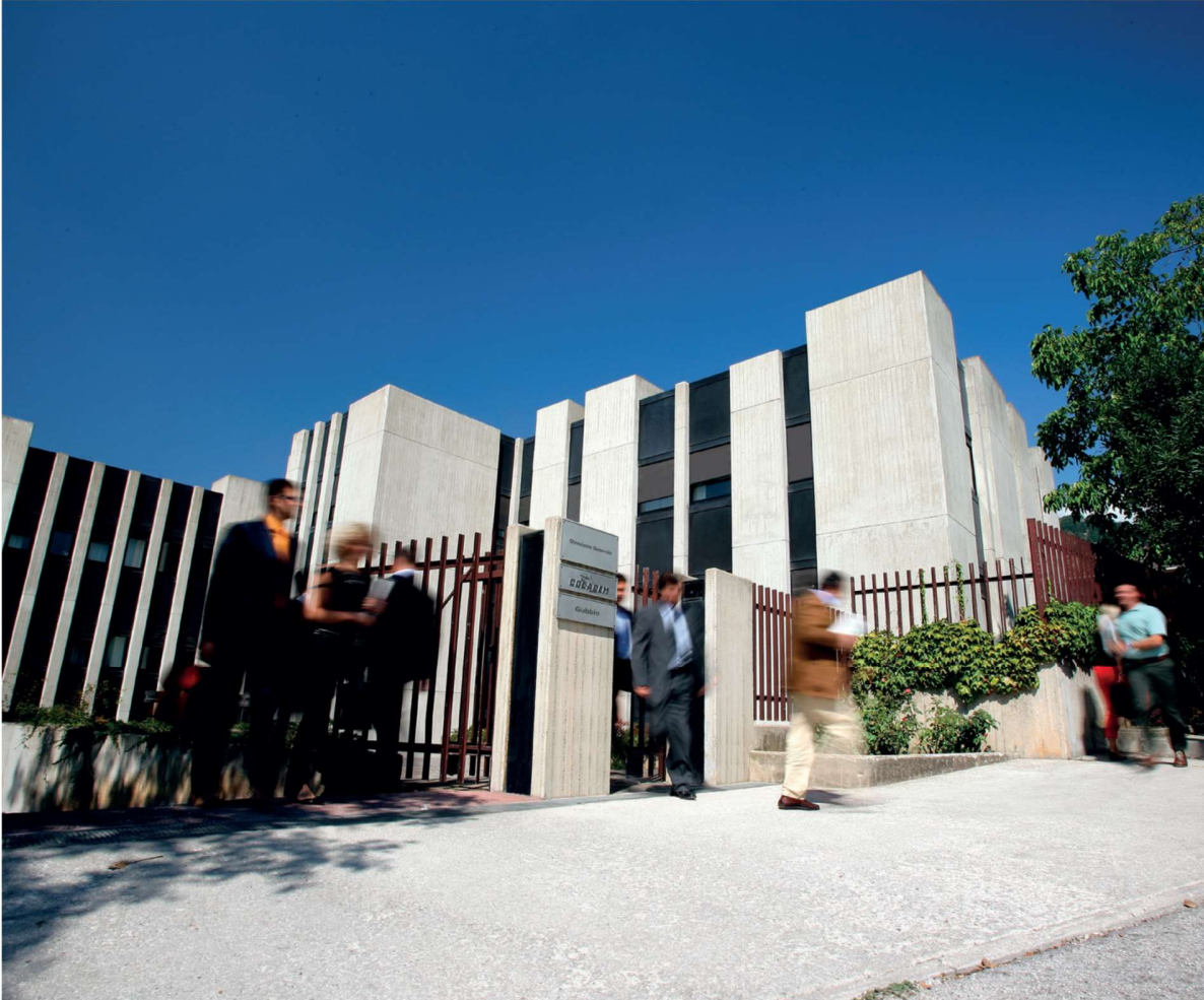
Figura 2 - Colacem, Direzione Generale - Gubbio (PG)

Colacem SpA è una realtà industriale attiva nella produzione di cemento.